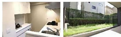
※掲載の写真は室内 2022 年 2 月、外観・庭 2021 年 10 月撮影。

※図面と現況が異なる場合は現況優先といたします。 ※物件売却済の場合はご容赦ください。 ※家具・調度品等は販売価格に含まれません。